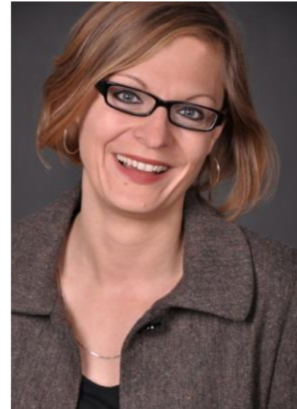
EU- und Drittmittelreferentin Kompetenznetzwerk Bibliotheken Deutscher Bibliotheksverband